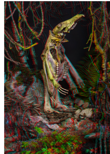
TRETTON Fine Art print. 50x70cm. Inkl. ram & glasögon Edition of 6. SEK 4.000