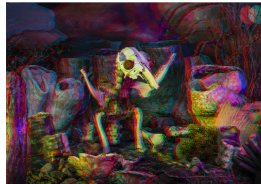
TIO Fine Art print. 70x50cm. Inkl. ram & glasögon Edition of 6. SEK 4.000