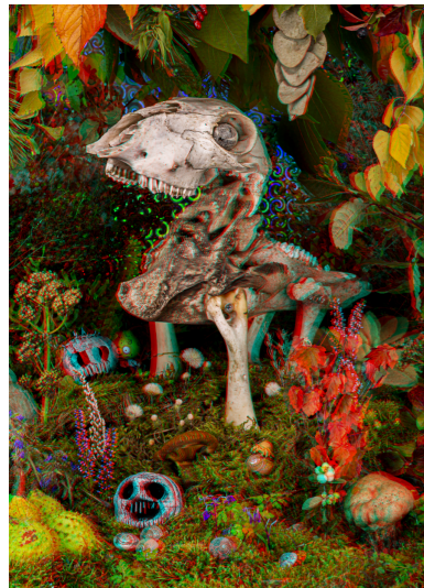
FEM Fine Art print. 50x70cm. Inkl. ram & glasögon Edition of 6. SEK 4.000