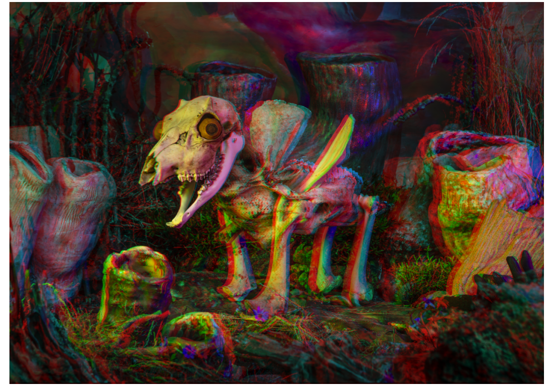
TOLV Fine Art print. 140x100cm. Inkl. ram & glasögon Edition of 6. SEK 9.000