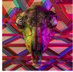
ETT Fine Art print. 30x30cm. Inkl. ram & glasögon Edition of 6. SEK 2.000