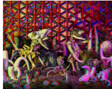
SJU Fine Art print. 50x40cm. Inkl. ram & glasögon Edition of 6. SEK 3.000