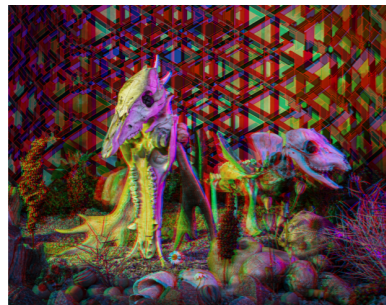
NIO Fine Art print. 50x40cm. Inkl. ram & glasögon Edition of 6. SEK 3.000