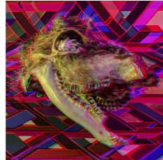
SEX Fine Art print. 30x30cm. Inkl. ram & glasögon Edition of 6. SEK 2.000