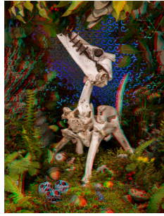
TVÁ Fine Art print. 30x40cm. Inkl. ram & glasögon Edition of 6. SEK 2.500