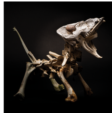
SJUTTON Fine Art print. 70x50cm. Inkl. ram Edition of 6. SEK 3.500