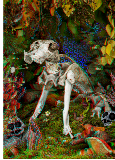
FYRA Fine Art print. 50x70cm. Inkl. ram & glasögon Edition of 6. SEK 4.000