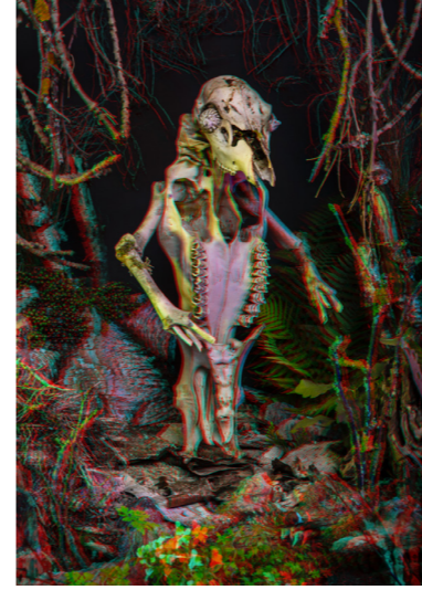
ELVA Fine Art print. 50x70cm. Inkl. ram & glasögon Edition of 6. SEK 4.000