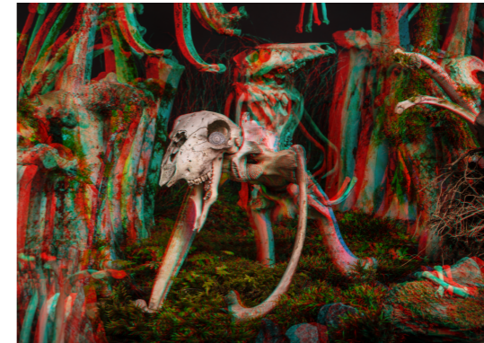
FJORTON Fine Art print. 70x50cm. Inkl. ram & glasögon Edition of 6. SEK 4.000