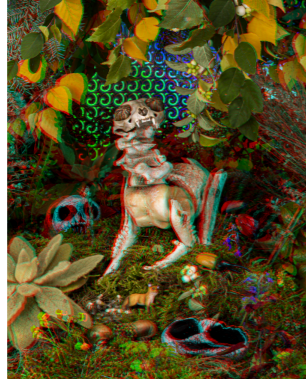
TRE Fine Art print. 40x50cm. Inkl. ram & glasögon Edition of 6. SEK 3.000