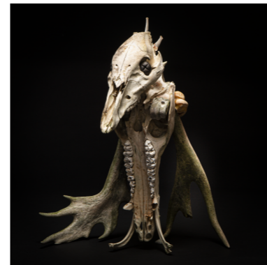
SEXTON Fine Art print. 70x50cm. Inkl. ram Edition of 6. SEK 3.500