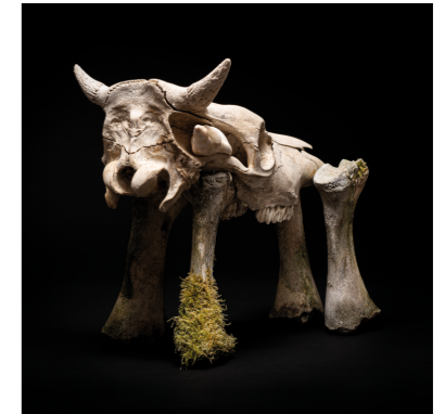
FEMTON Fine Art print. 70x50cm. Inkl. ram. Edition of 6. SEK 3.500