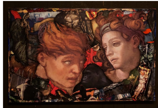
Who is that monkey between us? Collage 30 000 sek