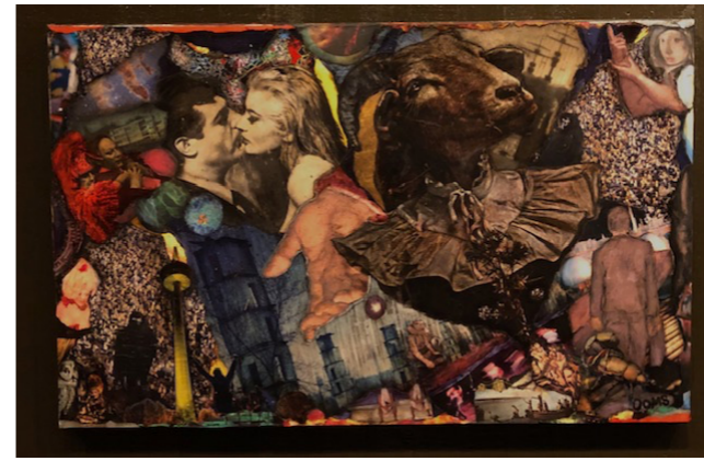
Avoid crowds and kiss in silence. Collage 30 000 sek