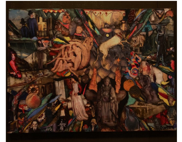
Undo and start again. Collage 30 000 sek