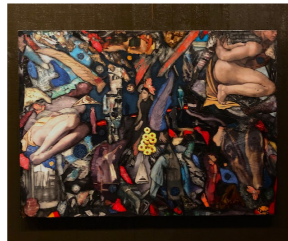
Disobey is the way Collage 30 000 sek