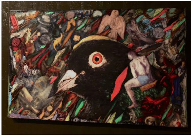
This pigeon is my God Collage 30 000 sek