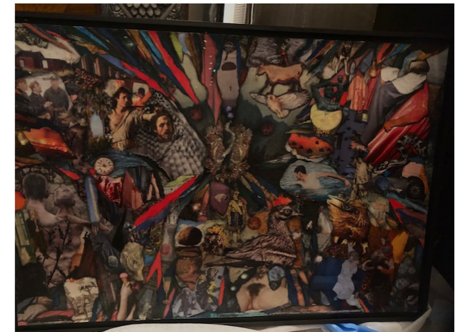
The swimmer will arrive soon. Collage 65 000 sek