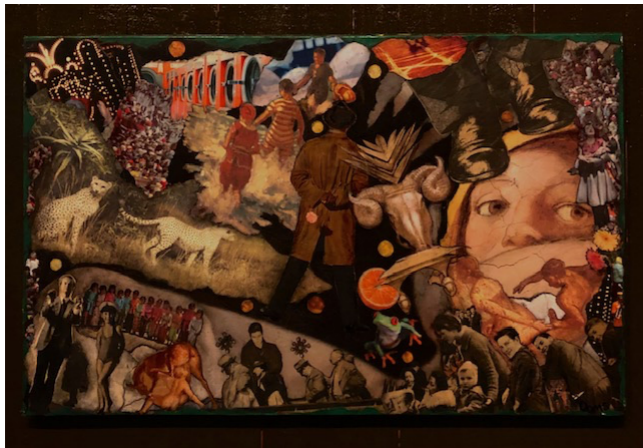
Hunt harder Collage 30 000 sek