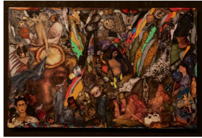
You can get what you want. Collage 30 000 sek